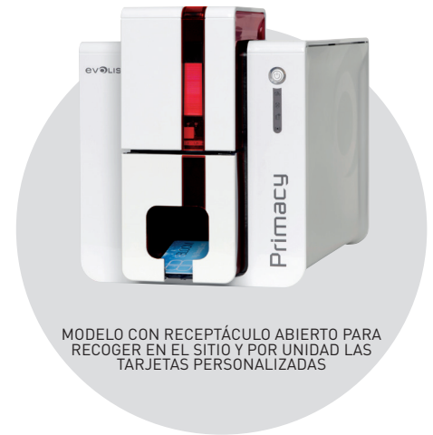
MODELO CON RECEPTÁCULO ABIERTO PARA RECOGER EN EL SITIO Y POR UNIDAD LAS TARJETAS PERSONALIZADAS