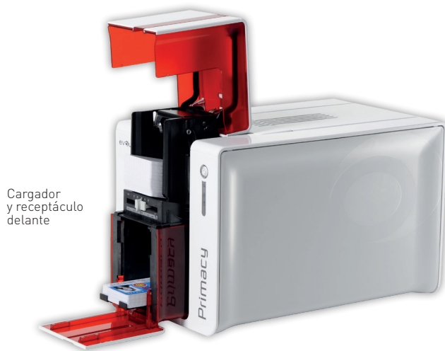
Cargador y receptáculo delante